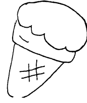
⑥アイスクリーム 180円